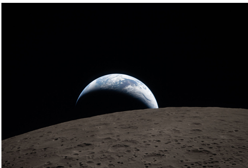
Coucher de Terre photographié par l'équipage de la mission Artemis II lors de leur survol de la Lune en avril 2026

Depuis les années 2000, la Lune retrouve un rôle central. Des pays comme la Chine, l'Inde ou le Japon y envoient des missions. Lancé par la NASA dans les années 2020, le programme Artemis vise à retourner sur la Lune avec des équipages, dont la première femme et le premier astronaute non blanc. L'objectif est d'établir une présence humaine prolongée, avec la construction d'une base lunaire.