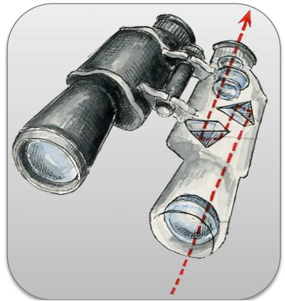
Dans une paire de jumelles