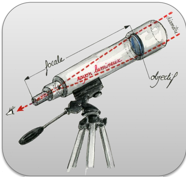
Dans une lunette